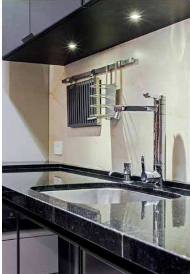
Na cozinha, itens indispensáveis pela funcionalidade: além da pia, foi incorporada uma ilha gourmet com bancada. Pontos de iluminação no teto e móveis valorizam o layout do home e estar